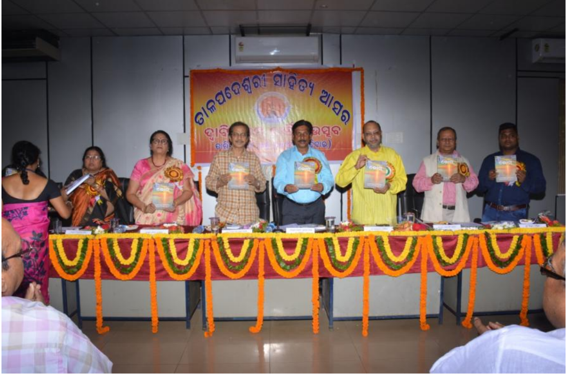
୨୦୧୮ ଡାକପଦେଶ୍ୱରୀ ସାହିତ୍ୟ ଆସରର ବାର୍ଷିକ ଉତ୍ସବ, ପି.ଜି. କାଉନସିଲ୍ ହଲ୍, ବାଣୀ ବିହାର