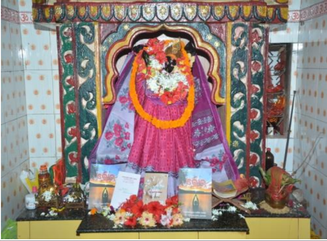
(ବାଣୀ ବିହାର କେନ୍ଦ୍ର ସ୍ଥାନରେ ପୂର୍ବରୁ ରହିଥିବା ଦେବାୟତନରେ ଅଧିଷ୍ଠିତା ମା ତାଳପଦେଶ୍ଵରୀ)

ଏହି ସବୁଜ ଅନୁଷ୍ଠାନଟି ବିକଶିତ ହୋଇଛି ଓଡ଼ିଶାର ସାରସ୍ଵତ ଶିକ୍ଷା ଅନୁଷ୍ଠାନ ଉତ୍କଳ ବିଶ୍ଵବିଦ୍ୟାଳୟ କେନ୍ଦ୍ରୀୟ ଲରେ ଆଦିମ କାଳରୁ ବିଦ୍ୟମାନ ଦେବୀ ତାଳପଦେଶ୍ଵରୀ ଠାକୁରାଣୀଙ୍କ ଆବିର୍ଭାବ ସ୍ଥାନରେ। ୧୯୯୭-୯୮ ମସିହାରେ ବାଣୀବିହାରର କେତେଜଣ ସାହିତ୍ୟାନୁରାଗୀ ବିଦ୍ୟାର୍ଥୀ କବିତାପାଠ କରିବାର ଆଗ୍ରହରୁ ଏହି ଅନୁଷ୍ଠାନର ଅଙ୍କୁରୋଦ୍ଗମ ହୋଇଛି। ପରେ ପରେ ଜଣଙ୍କ ପରେ ଜଣେ ଅଧ୍ୟାପିକା, ପ୍ରଫେସର ଆଉ ଭାଷା ସାହିତ୍ୟକୁ ଆଦର କରୁଥିବା ବ୍ୟକ୍ତି ବିଶେଷ ଏହା ସହିତ ସମ୍ପୃକ୍ତ ହୋଇ ଆସରଟିକୁ ସୁସଂଗଠିତ କରି ନିୟମିତ କବିତା ଆବୃତ୍ତି ବଳରେ ସୃଜନଶୀଳତାର ପରାକାଷ୍ଠା ଦର୍ଶାଇପାରିଛନ୍ତି। ଆସର ଆଜି ଦ୍ଵାବିଂଶ ବର୍ଷ ଯୌବନରେ ପଦାର୍ପଣ କରିଛି।