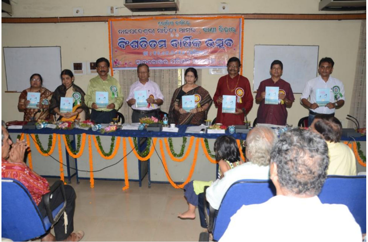
୨୦୧୭ ତାଳପଦେଶ୍ୱରୀ ସାହିତ୍ୟ ଆସରର ବାର୍ଷିକ ଉତ୍ସବ, ପି.ଜି. କାଉନସିଲ୍ ହଲ୍, ବାଣୀ ବିହାର

(ଉପରୋକ୍ତ ଆଲୋଚ୍ୟା ବିଜୟିନୀ ସ୍ମୃତି ଟ୍ରଷ୍ଟ ଡରଫରୁ ପ୍ରକାଶିତ)